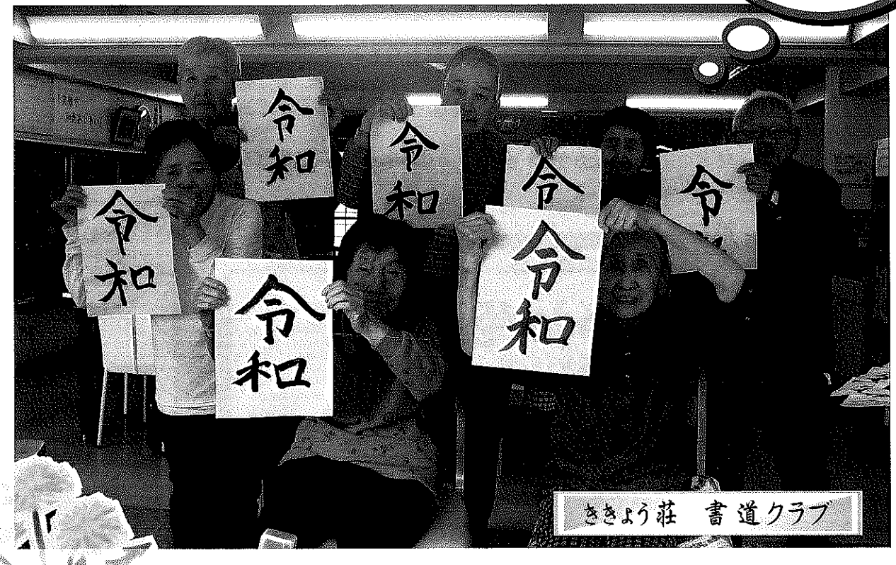
ききょう荘 書道クラブ